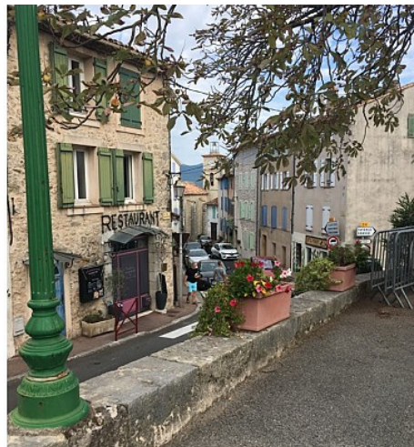
Place Champ de Foire

Ici on travaillait le verre, il fallait du bois pour les fours de la verrerie qui paraît-il, existait au Moyen-Age - toujours est-il qu'elle fut importante aux 17ème et 18ème siècles, jusqu'à 40 ouvriers y confectionnaient bouteilles, verres à verre et la fameuse "Dame Jeanne", bouteille ronde dont la légende dit qu'elle doit son nom à la visite à Saint-Paul de la reine Jeanne de Naples, comtesse de Provence qui - fuyant Naples - se perdit en chemin. Les fours de la verrerie s'éteignirent en l'an 1872.