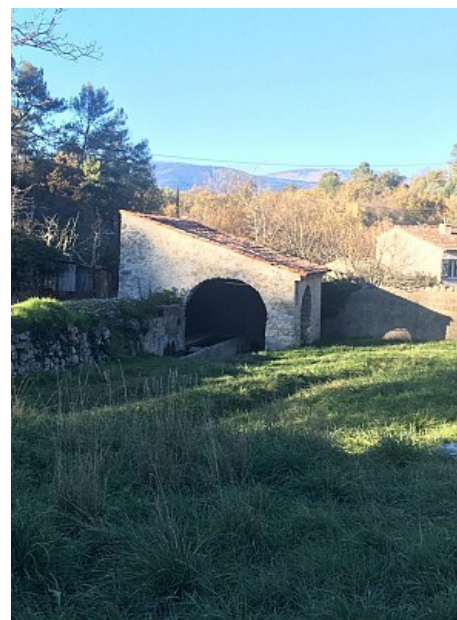
Lavoir du Pascaret

Ici, les villageoises venaient se rencontrer et laver leur linge.