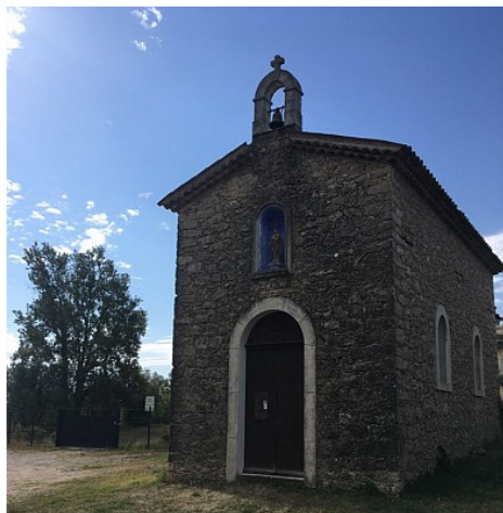
Chapelle St Paul

L'ancienne chapelle Saint-Joseph fut détruite en 1885 lors du tracé de la route de Draguignan, puis reconstruite en haut du village à la fin du siècle (19ème).