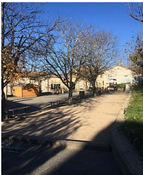
Place Champs de Foire

Très courue, la Foire de Janvier se tenait sur le Pré de Foire qui en 1847 fut rebaptisé "Champ de Foire", le magnifique escalier de pierres de taille et les entrées latérales furent construits pour faciliter l'accès des acheteurs et des paysans. Un puits communal, aujourd'hui disparu élevait autrefois sa tour carrée sur cette place.